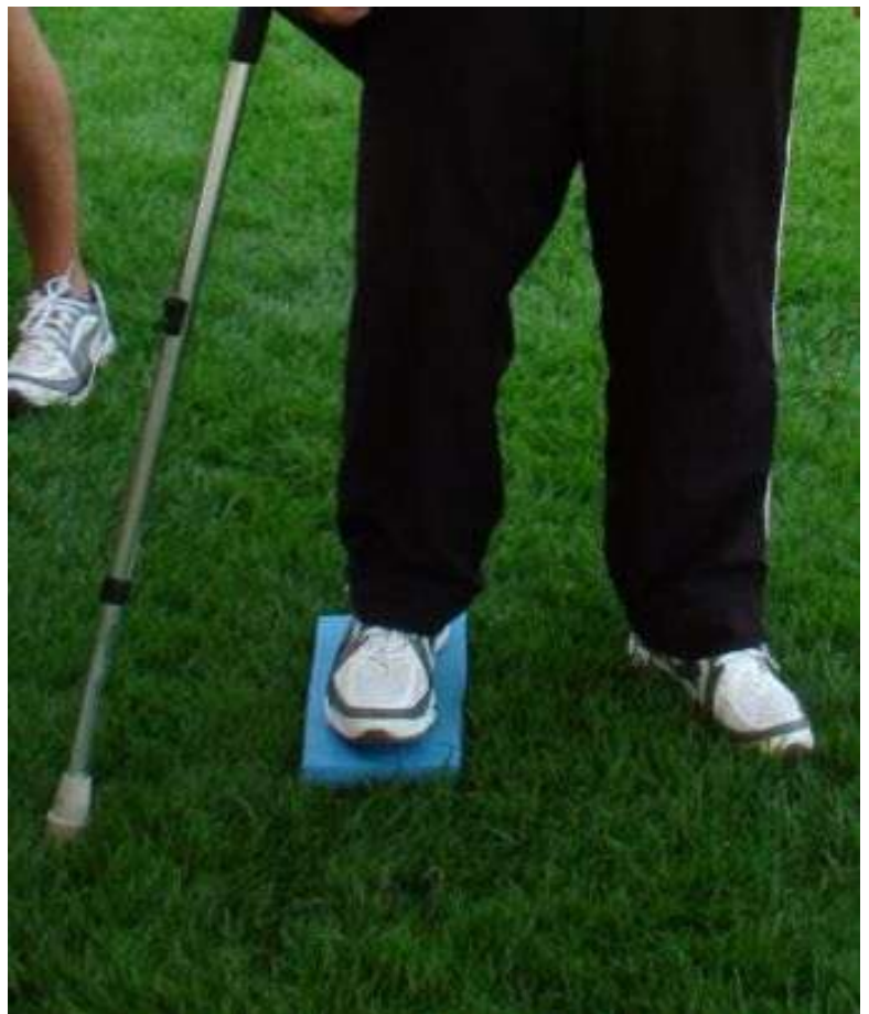
Athlète debout avec soutien sous le pied