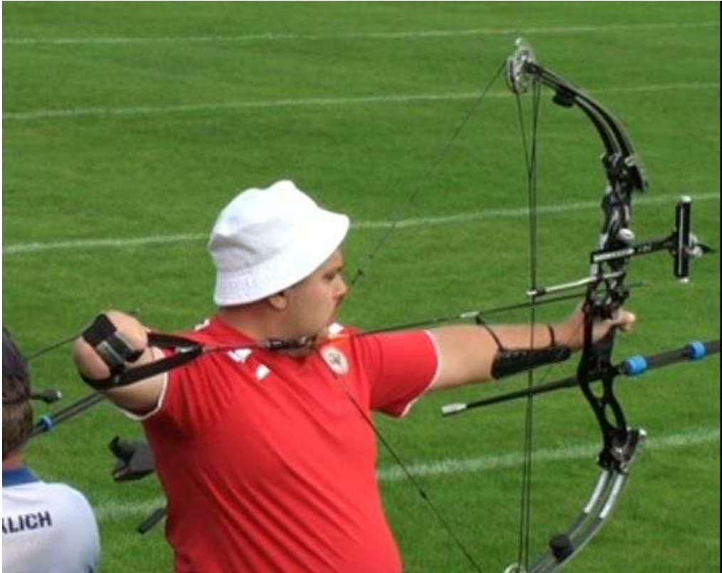
Athlète debout amputé.