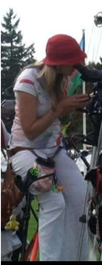
Athlète debout avec soutien (tabouret)

a) Standing Man ou Standing Women = moins valides qui tiennent en station debout soit avec ou sans aide ou qui utilisent une aide à la décoche